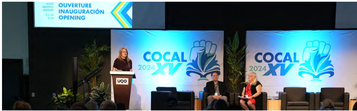
Congrès de la COCAL 2024