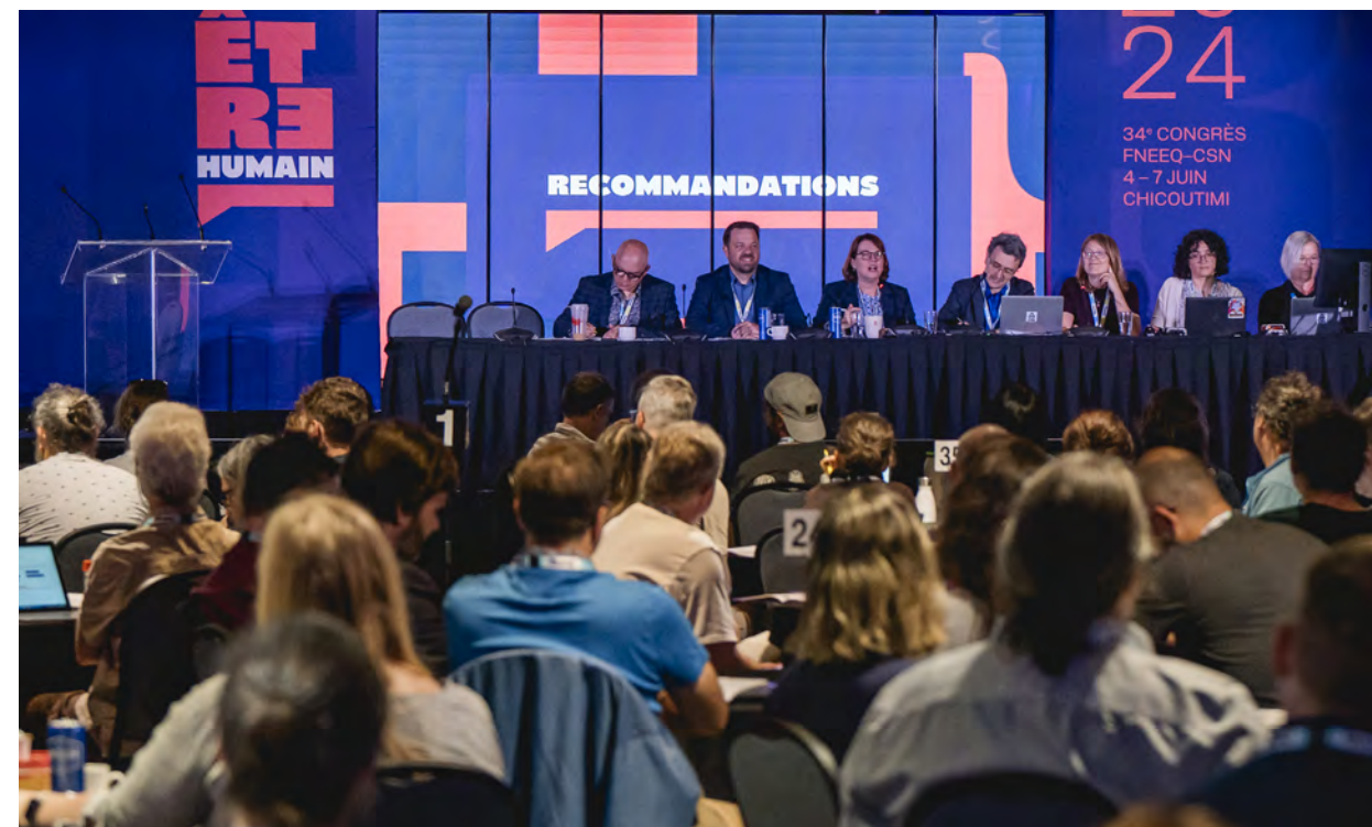
Les congressistes ont adopté une série de recommandations durant le 34 e congrès de la FNEEQ, en juin dernier à Chicoutimi

Avec les progrès du Rassemblement national en France, l'élection de Trump aux États-Unis ou le spectre d'un gouvernement Poilievre à Ottawa, il serait facile de se démotiver. Au contraire! Trouvons-y le courage pour poursuivre la mobilisation, de diffuser notre message et nos revendications, d'élargir notre base militante. Comme disait Marcel Pepin, président de la CSN de 1965 à 1976, « il ne suffit pas d'avoir raison, encore faut-il avoir la force d'avoir raison ».