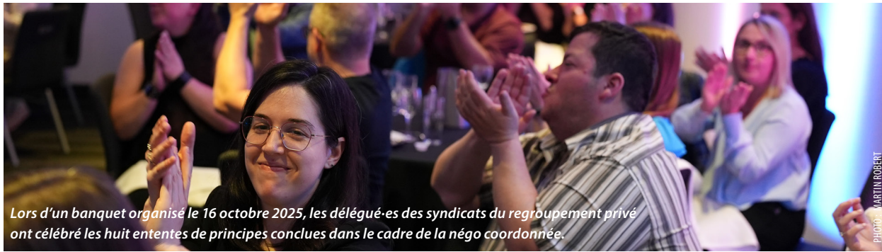
Lors d'un banquet organisé le 16 octobre 2025, les délégué-es des syndicats du regroupement privé ont célébré les huit ententes de principes conclues dans le cadre de la négo coordonnée.