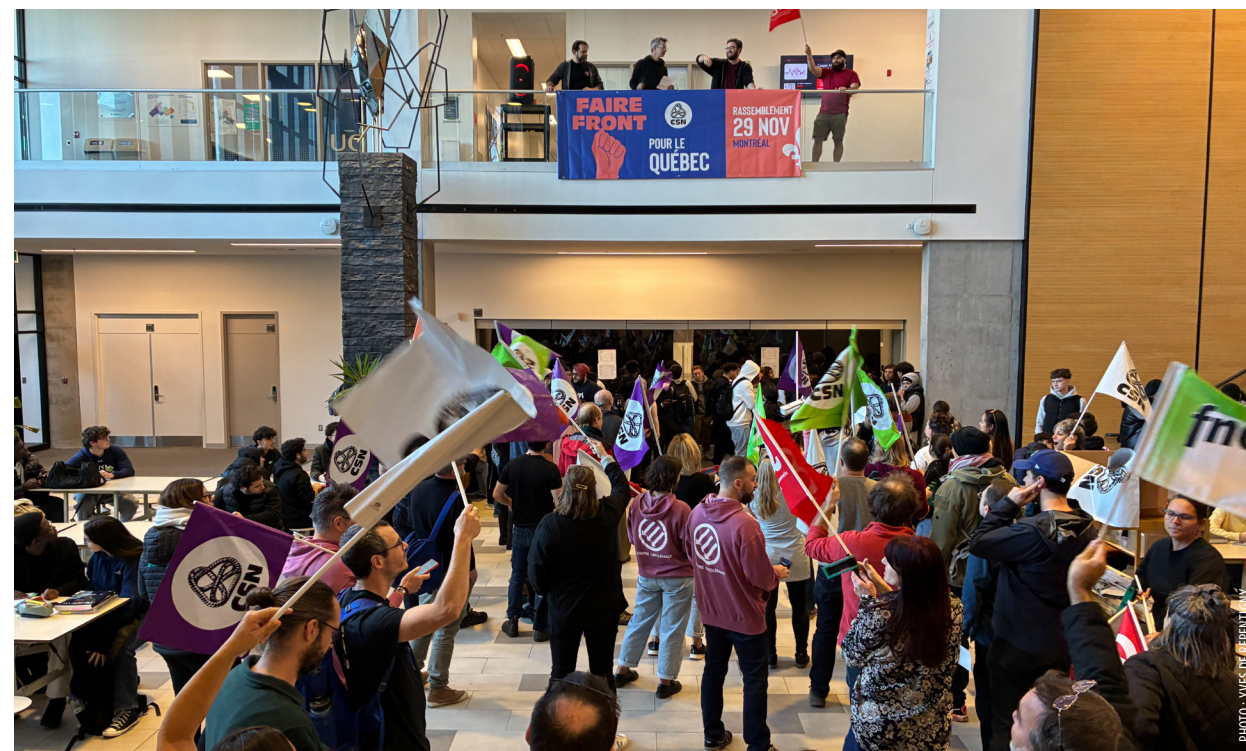
Mobilisation intersyndicale contre l'austérité caquiste au Collège Montmorency lors d'une semaine d'actions locales, en octobre dernier.

Notre combat est juste, et nous sommes heureuses et heureux de le mener avec vous!