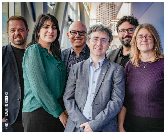
Le comité exécutif

L'automne qui s'achève aura été une formidable occasion de mobilisation pour la FNEEQ et ses syndicats affiliés. Le remaniement ministériel de septembre a généré plus qu'un jeu de chaise musicale, exercice coutumier lorsque les gouvernements tentent de se donner un élan en fin de mandat. Il a marqué une radicalisation du ton (et des actions) du cabinet Legault, clairement désespéré face à des sondages qui relèguent la CAQ dans les bas-fonds de l'opinion publique.